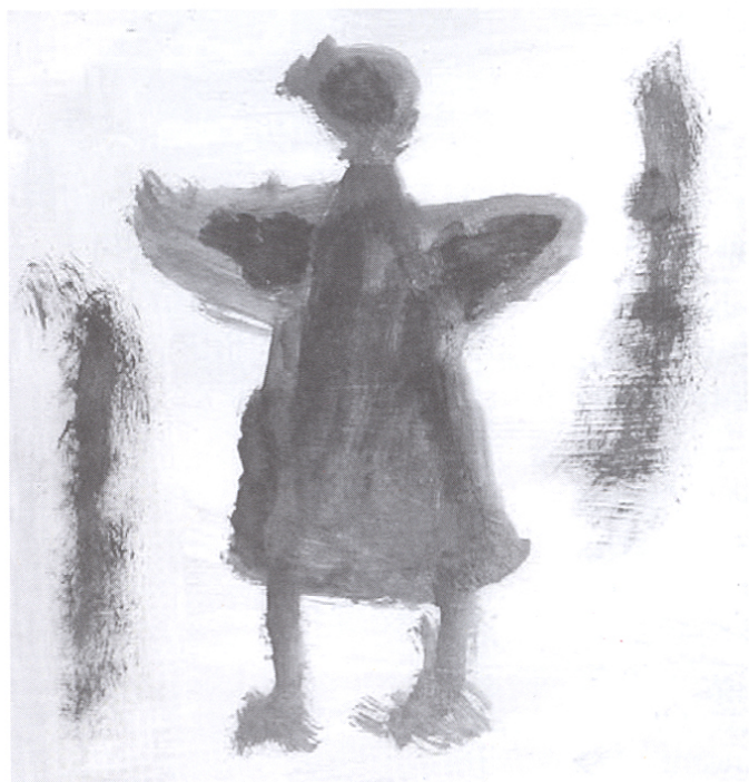
Dibujo: por Peter Villeger for the Disability Mural para el Mural de Discapacidades